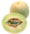
melón dulce honeydew

Espera precios altos hasta principios de diciembre. La temporada de Salinas concluirá. Las temporadas de Huron y Oxnard también están concluyendo. Los suministros aumentarán en la región del desierto de Arizona-California mientras que la cosecha se impulsa. MFC Lechuga Orejona Verde Premium está disponible; MBA se está sustituyendo cuando se necesita.